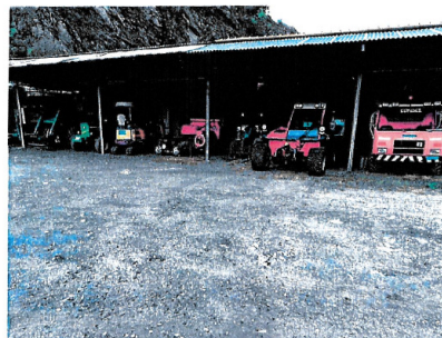
Tettoia con licenza edilizia 2012 ancora integra