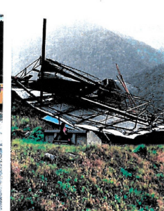
dopo l'evento (ottobre 2023)